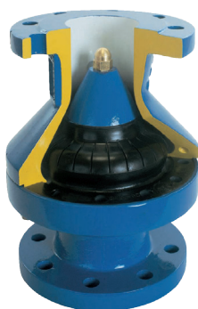
VAG TOP-STOP®, вид в разрезе